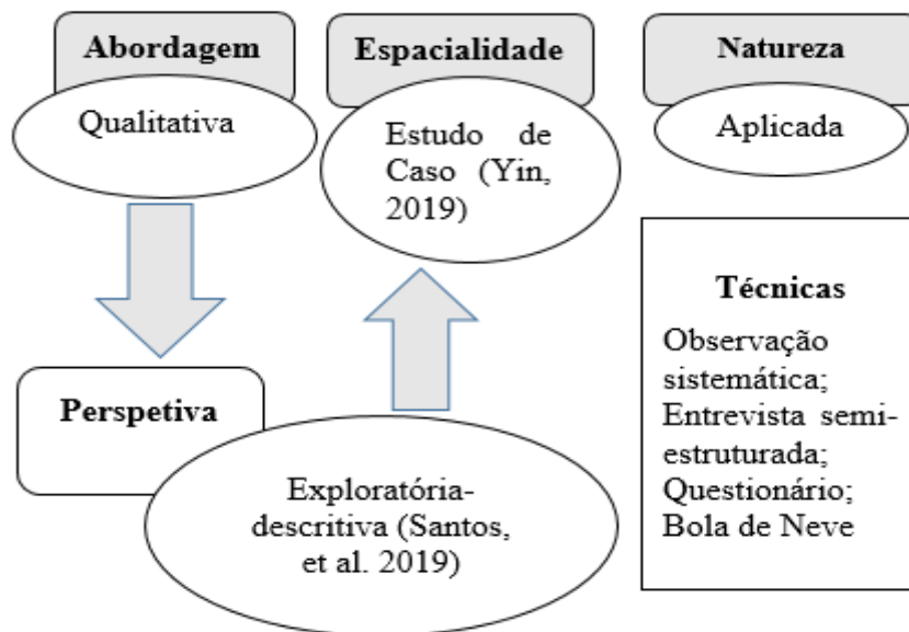
Figura 1. Esquema de procedimentos metodológicos

O esquema representa a síntese dos procedimentos metodológicos incluindo o tipo de pesquisa, abordagem, o lugar de estudo, a natureza e as técnicas de recolha dos dados.