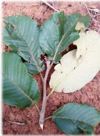
Monotes hypoleucus (Oliv.) Gilg var. discolor (R.E.Fr.) Meerts