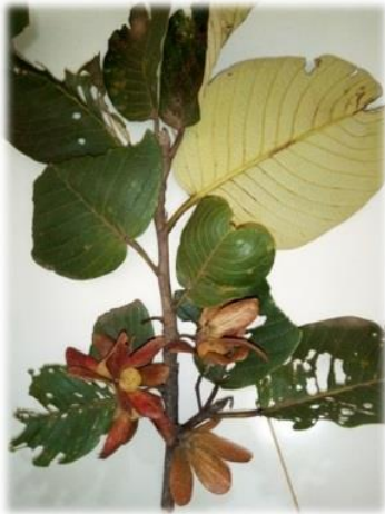
Monotes hypoleucus (Oliv.) Gilg var. hypoleucus