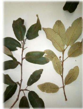
Monotes hypoleucus (Oliv.) Gilg var. angolensis (De Wild.) Meerts

Esta presente también Monotes dasyanthus var. dasyanthus (figura 3), especie reportada en el estudio hecho por Siquilile (2012) como la cuarta más abundante en el bosque.