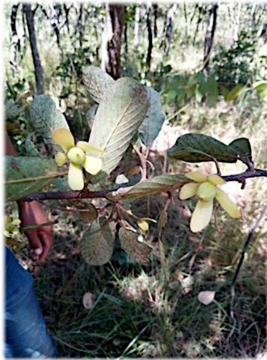
Figura 4 - Morfoespecie del género Monotes no identificada, presente en el bosque de miombo Brito Texeira.

Por último, fue identificada por el especialista Meerts (2021) la especie Monotes gossweileri (Figura 5), endemismo de Angola, considerada como vulnerable por tener una muy pequeña o restringida población (Catarino et al., 2013). Esto favorece el incentivo por investigar la especie para su conservación y protección.