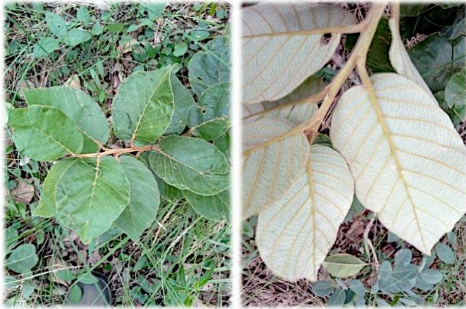
Figura 5 - Aspecto de las hojas de Monotes gossweileri por sus caras adaxial y abaxial.

La diversidad de especies del género Monotes , encontrada en esta investigación, es el segundo mayor reporte de especies de este género en toda Angola después del publicado por Revermann et al. , (2017), quienes informan la presencia de Monotes africanus , Monotes angolensis , Monotes caloneurus y Monotes dasyanthus en 100 km 2 de bosque de miombo de Cusseque, provincia de Bie, ubicado en la llanura del Centro Sur de Angola y en la parte alta de la Cuenca Hidrográfica del río Okavango. Esta semejanza quizás responda a que ambas masas forestales estaban más cercanas a la naturalidad o con un leve grado de degradación.